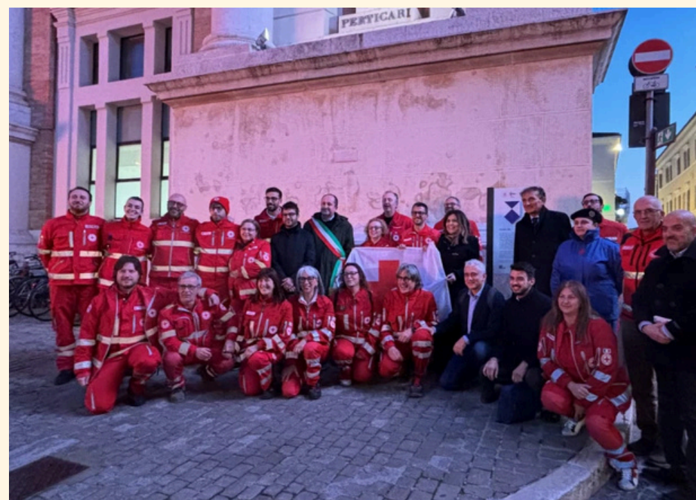
7 Marzo 2024 Piazza del Popolo

Nell'anno di Capitale Italiana della Cultura, a Pesaro sono stati apposti tre Scudi Blu, il simbolo internazionale di protezione dei beni culturali dai rischi dei conflitti armati, previsto dalla Convenzione dell'Aja del 1954.