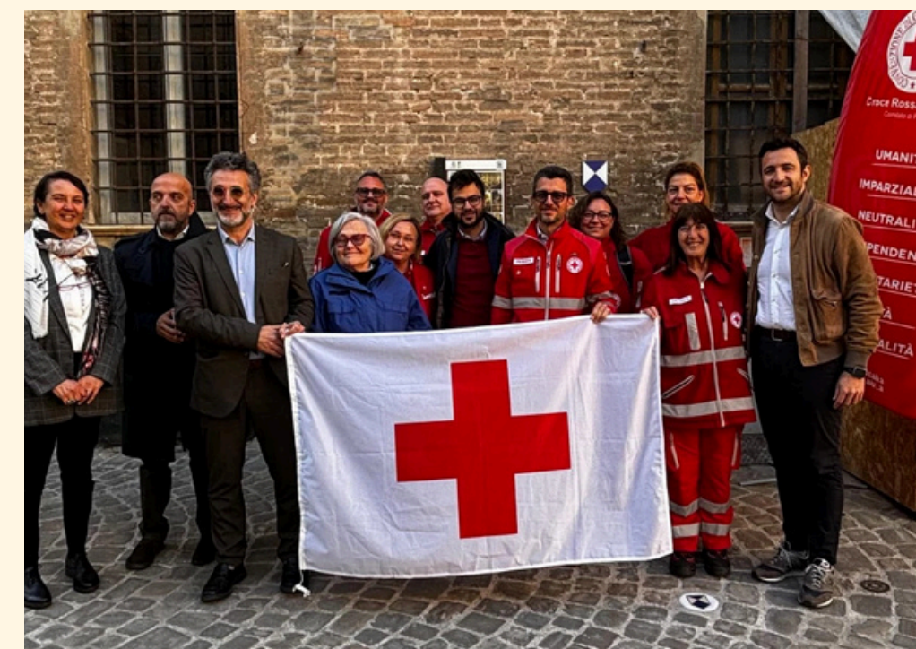
2 Maggio 2024 Palazzo Mosca