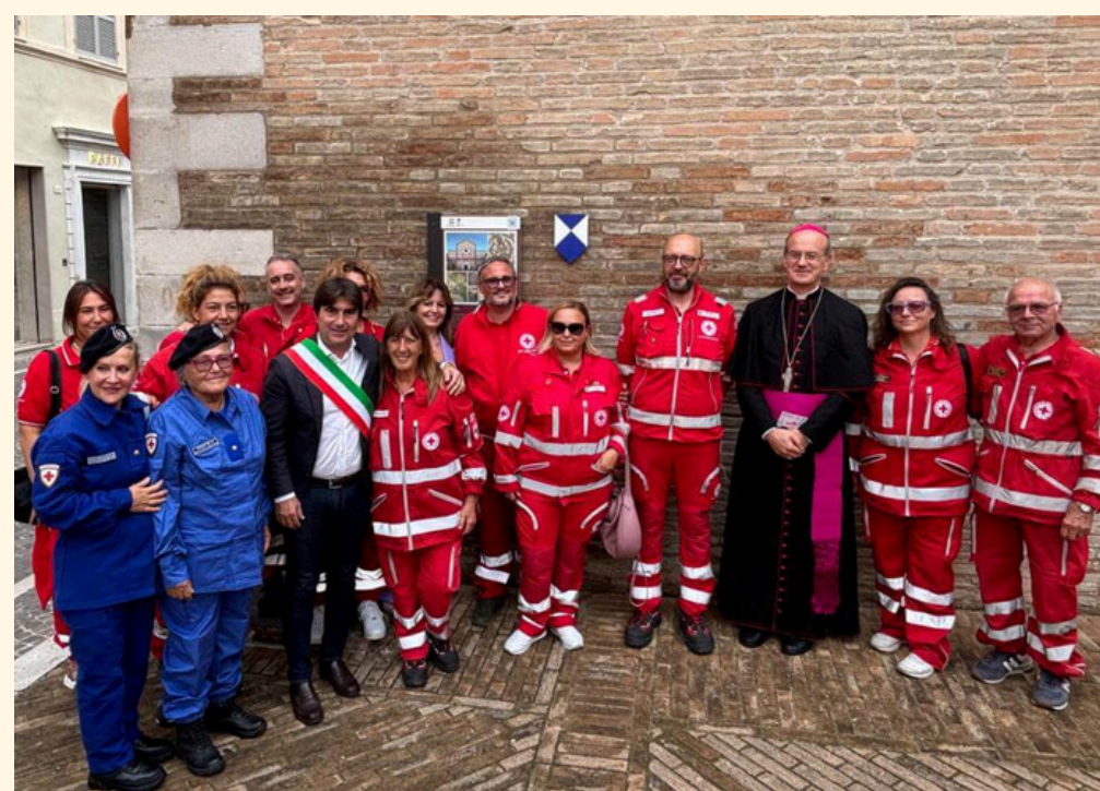
24 Settembre 2024 Basilica Cattedrale S. Maria Assunta